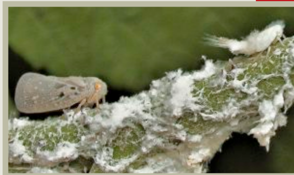
Gebietsfremde Insekten wie die invasive Bläulingszikade werden in ihrer Ausbreitung überwacht. Seiten 22–23