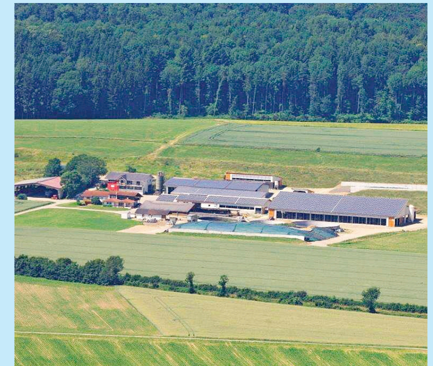
Das Hofgelände der Familie Schwab in Lauchringen. In zwei Jahren wurden ein Milchviehstall für 200 Kühe, ein Kälberstall und ein Abkalbestall neu errichtet.

Licht zur Verfügung stehen. Im Laufstall können die Kühe selbst wählen, wann sie fressen, liegen oder eine Runde im Stall drehen möchten. Dadurch werden die Tiere möglichst wenig in ihrem artspezifischen Verhalten eingeschränkt.